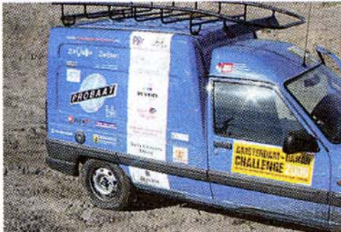
'Het barrel', de Probaatblauwe Renault Express

De spelregels zijn eenvoudig: 'Met een barrel van maximaal 500 euro vertrekken de meiden op 25 november a.s. unsupported vanuit Amsterdam naar Dakar. Bij aankomst gaat de organisatie de auto veilen in Banjul (Gambia) en de opbrengst wordt volledig ter beschikking gesteld aan het door ons gekozen goede doel Stichting Nice to be nice.'